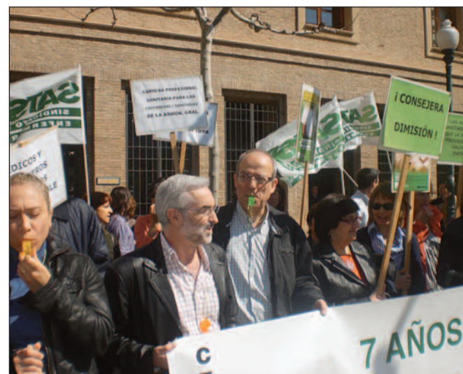
La enfermería aragonesa se ha movilizado en numerosas ocasiones