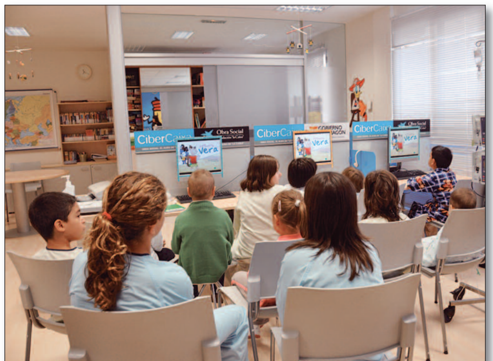
'Vera la enfermera' visita a los niños aragoneses. Las campañas de información sobre la labor de la enfermera también son importantes. Por eso SATSE Aragón lleva a Vera a cole-

las necesidades socio-sanitarias de la población y subrayaron su papel en los proyectos de cooperación. Este programa se desarrolló en Huesca y Zaragoza.