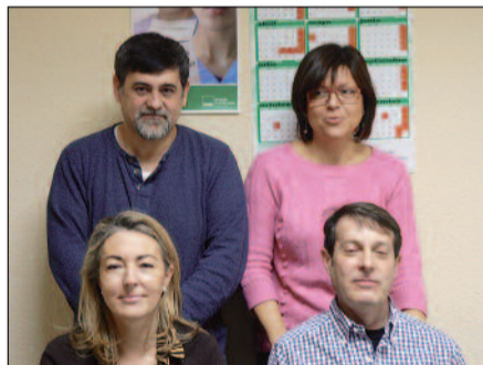
De izda a dcha. y de arriba a abajo, responsables de los sectores de Alcañiz, Administración General, Barbastro, Sector 1 Zaragoza, Sector 3 Zaragoza, Huesca, Teruel y Sector 2 Zaragoza