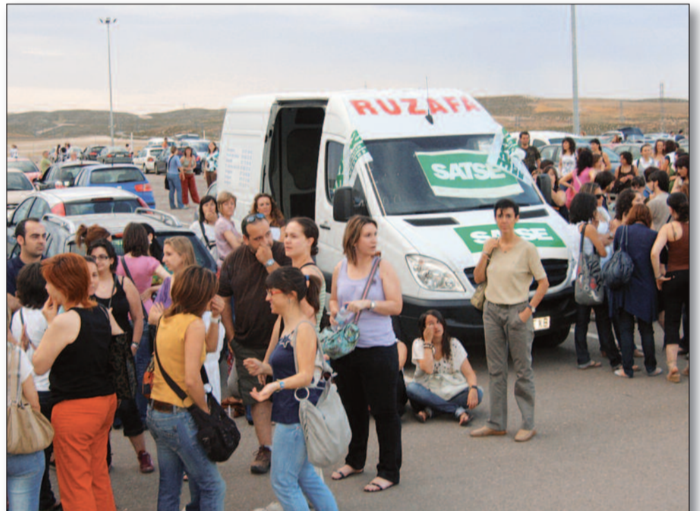
SATSE, con los profesionales de enfermería que opositaban. El Sindicato acudió a las oposiciones que se celebraron en Aragón. Delegados de SATSE, debidamente identificados para

das por FUDEN, que se centraron en el protagonismo que deben tener los enfermeros ante la evolución del SNS en base a los cambios que se están produciendo en la sociedad.