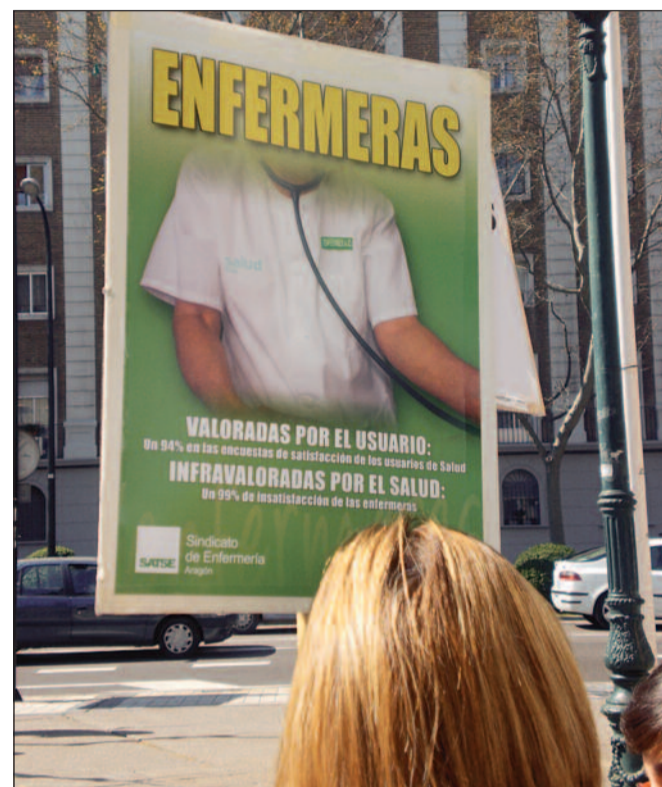
Es necesario que se reconozca el papel de la enfermería