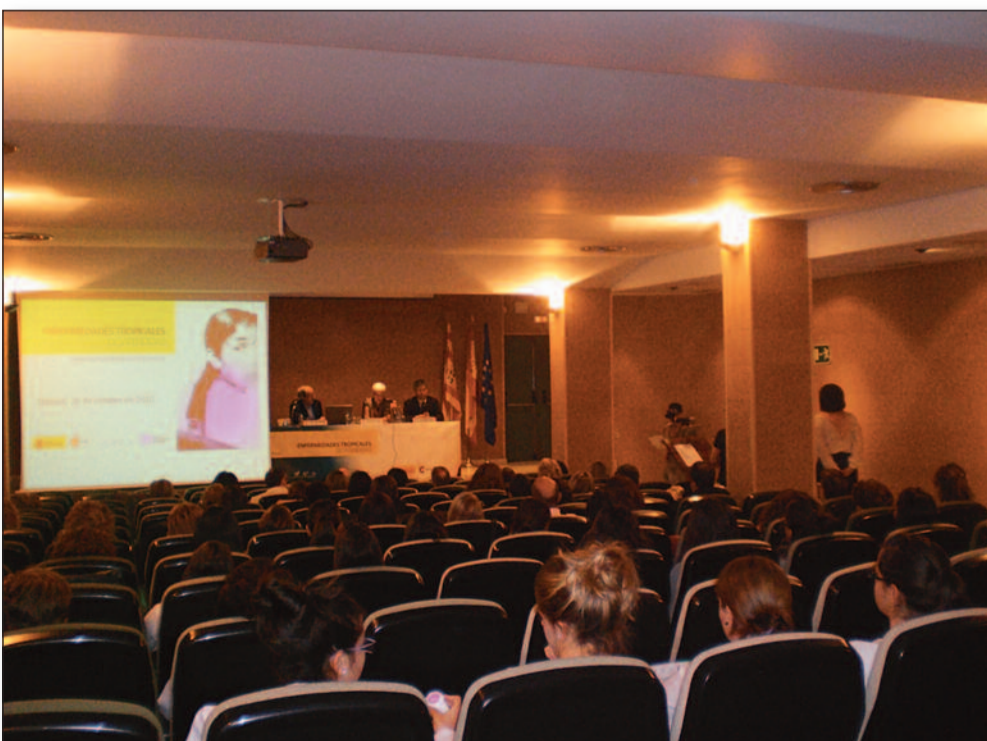
SATSE reunió a profesionales de todo el mundo. Las primeras jornadas internacionales de Salud y Desarrollo, destacaron la importancia profesional de la enfermería para detectar

que fuese fácil localizarlos, prestaron todo el apoyo que fue necesario, respondieron a las dudas de los opositores y les entregaron la información que se les solicitaba.