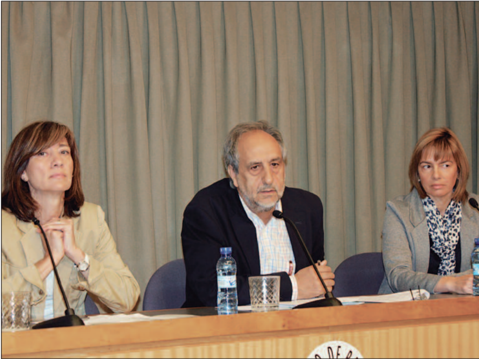
25 años trabajando por la enfermería en Aragón. SATSE lleva un cuarto de siglo reivindicando la mejora de la profesión en la Comunidad, actualmente cuenta con más de 3.500 enfermeros, y sigue luchando por y para los profesionales de enfer-

mería. En todos estos años ha demostrado que trabajando duro se pueden conseguir mejoras laborales, retributivas y profesionales. Para celebrar esta fecha, el 18 de mayo, se consiguió llenar el Teatro Principal de profesionales de enfermería, y allí