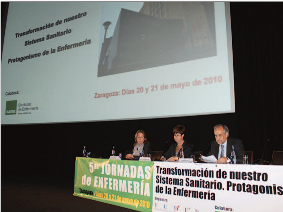
La Enfermería debe adquirir un mayor protagonismo, incrementando su marco competencial. Con un éxito rotundo se desarrollaron las quintas jornadas de enfermería, organiza-

das por FUDEN, que se centraron en el protagonismo que deben tener los enfermeros ante la evolución del SNS en base a los cambios que se están produciendo en la sociedad.