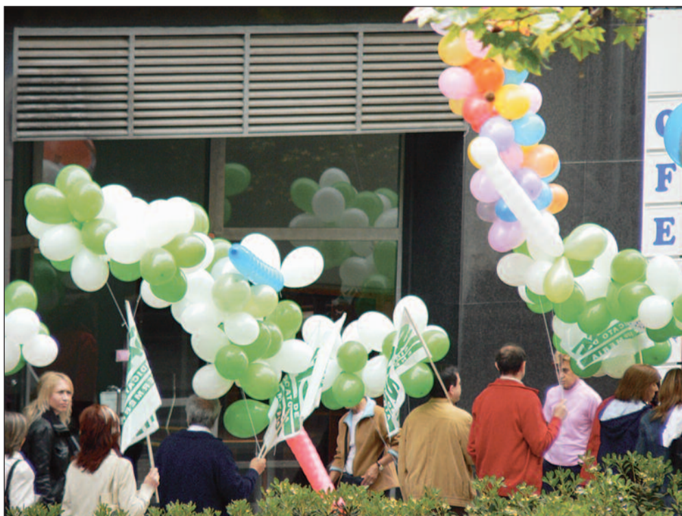
SATSE reclama la revisión del Pacto de Permisos y Vacaciones de 2006